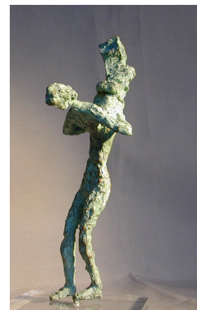
Personnages bronze hT 17 - 20 cm