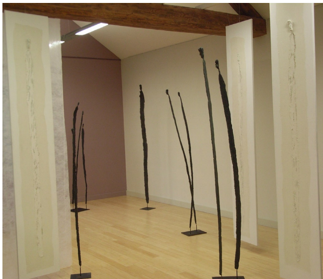
Exposition Saône - Silhouettes résine Ht 1,85 - 2,00 m - sur toile Ht 2,50 m