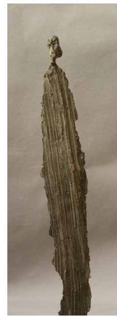
Silhouettes bronze 35 - 70 cm