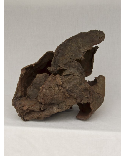
C o c o n s Bronze 30-40 cm