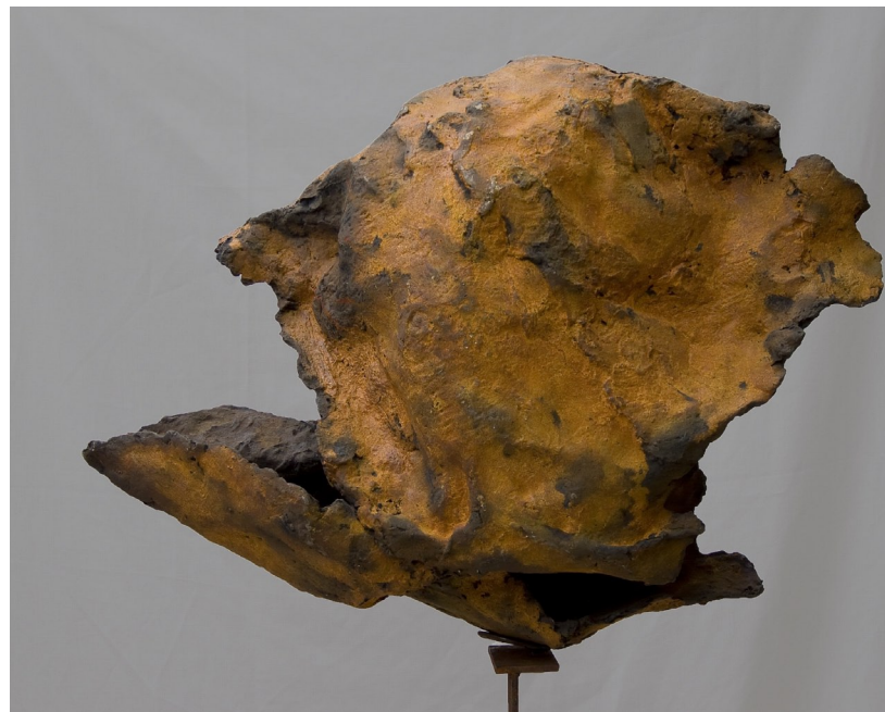
P o i s s o n résine HT 60 cm