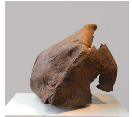
C o c o n s Bronze 60-80 cm