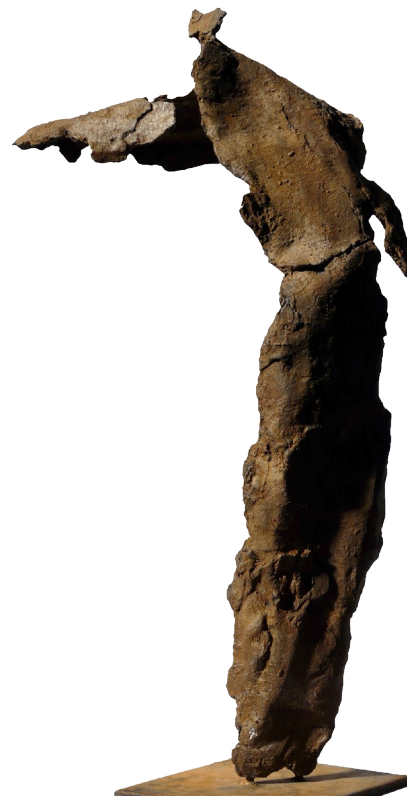
Samothrace bronze HT 50 cm