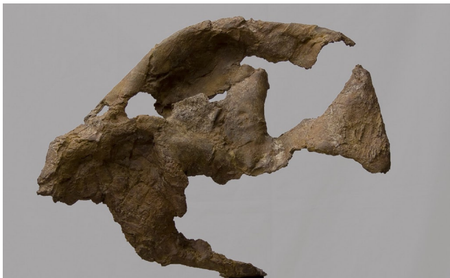
F o s s i l e bronze HT 48 cm