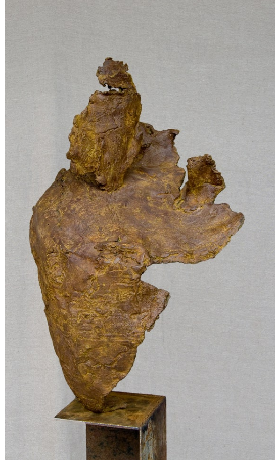
B u s t e bronze HT 65 cm