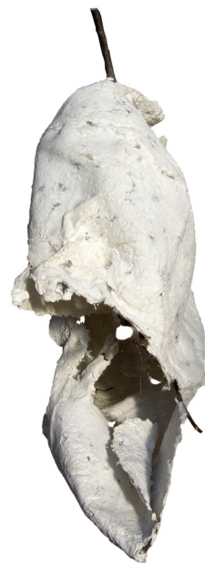
C o c o n s cellulose 60-80 cm