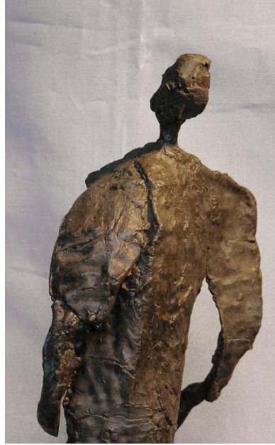
D r a p é s bronze HT 40- 60 cm