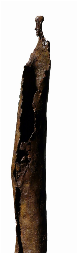
Empreinte bronze HT 60 cm