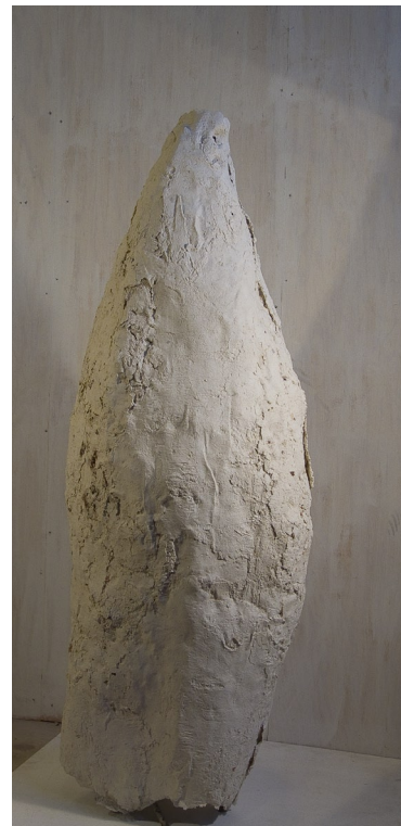
C o c o n cellulose HT 110 cm