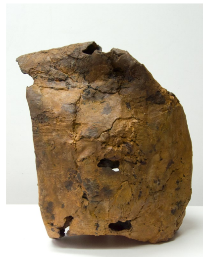
C o c o n s résine 60-80 cm