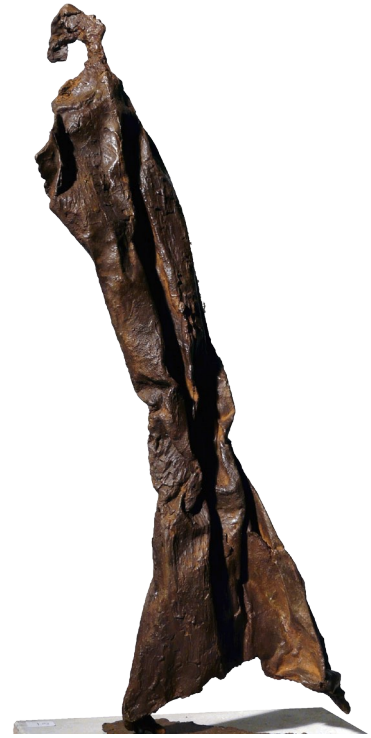
Empreintes bronze hT 33 - 50 cm